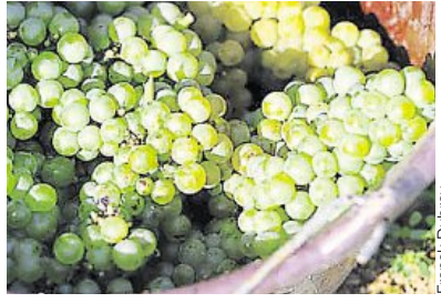
Les vignerons de Nantes présenteront une cuvée de choix pour montrer leur savoir-faire lors de la Folle journée.

Les deux parties trouvent leur compte dans ce partenariat : « Fortement identitaire et rattaché à l'ADN de Nantes, le muscadet partage les valeurs de la Folle journée autour de l'accessibilité, du partage et de la création. C'est aussi une formidable occasion de célébrer l'accord musique et vin. » Il permet aux orga-