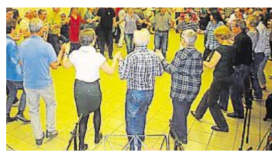
Les participants au fest-noz pourront s'initier à la danse à 19h.

De 13 h 30 à 19 h, le fest-noz sera précédé d'un concours de musique et d'un concours de danse avec un jury de professionnels, qualificatif pour le championnat individuel de danse traditionnelle de Bretagne, organisé à Gourin (Morbihan) en septembre 2017. Les inscriptions, gratuites, au concours de danse seront prises le jour même, sur place. Une initiation à la danse sera proposée à 19 h pour les participants au fest-noz.