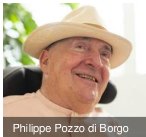
Philippe Pozzo di Borgo

2015 Nantes. Une journée « fragilité-partage » Plus de 400 participants