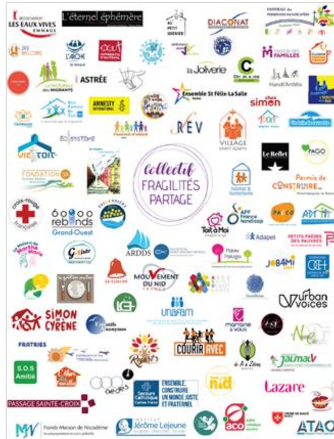
Les associations du Collectif