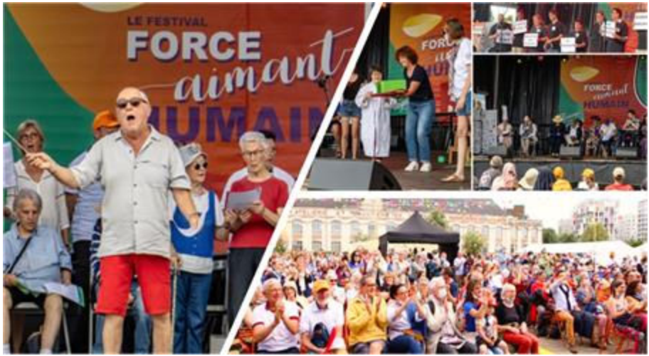
Une grande scène pour les plus fragiles

Bilan de l'Édition N°2 (suite) : focus sur la journée du 10 juin 2023 qui a vu le montage et l'animation du Village des Fragilités sur le Parc des Chantiers, à Nantes.